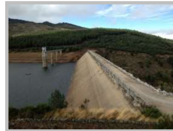
Presa Béjar (río Angostura, Salamanca)