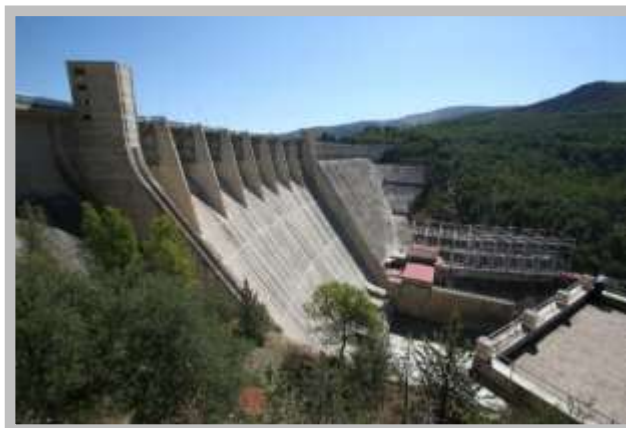
Presa Iznájar (río Genil, Córdoba)