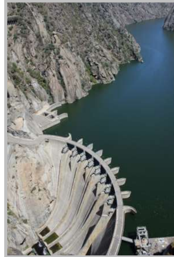
Presa Aldeadavila (río Duero, Salamanca)